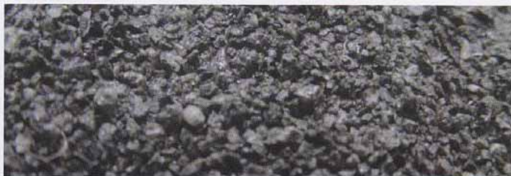
1994年使用前拡大写真

人口密度の高い日本では家屋が小さく密集している為、行政は住宅所有者や建築業者に対して厳しい建築基準を課さざるを得ない状況にあります。