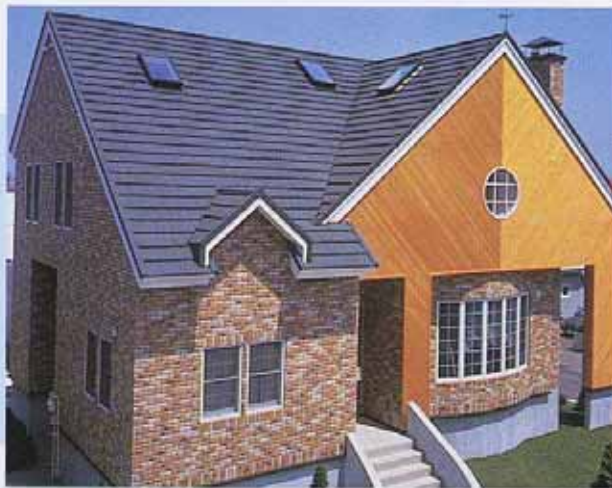
コロナ 1994 (カネイチ神榮建設施工物件)