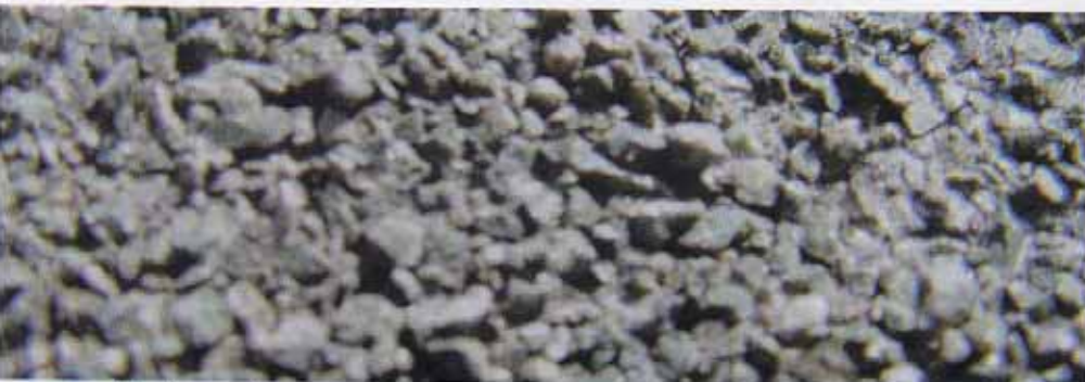
1994年施工後8年経過の拡大写真

特に積雪地域に自信を持ってお勧めできる AHI ルーフィングシステムは、軽さに加え、優れた耐久性と確かな安全性で多くの支持を得ております。重厚な外観の天然石ストーンチップコーティングは、塗装などのメンテナンスが不要で、春の雪融け後も剥がれや色落ちのない変わらぬ美しさを保ちます。雪が降らない時期に雪留め金具が家全体の美観を損なうこともありません。大切な資産としての家と家族の安全を守る AHI ルーフィングシステムは、皆様に末永くご愛用いただけることでしょう。