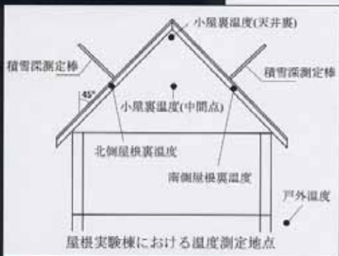
Rest roof design